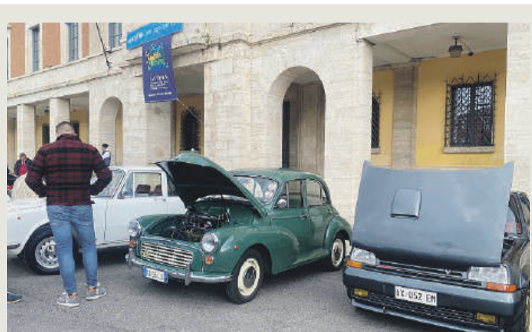
Un momento dell'evento